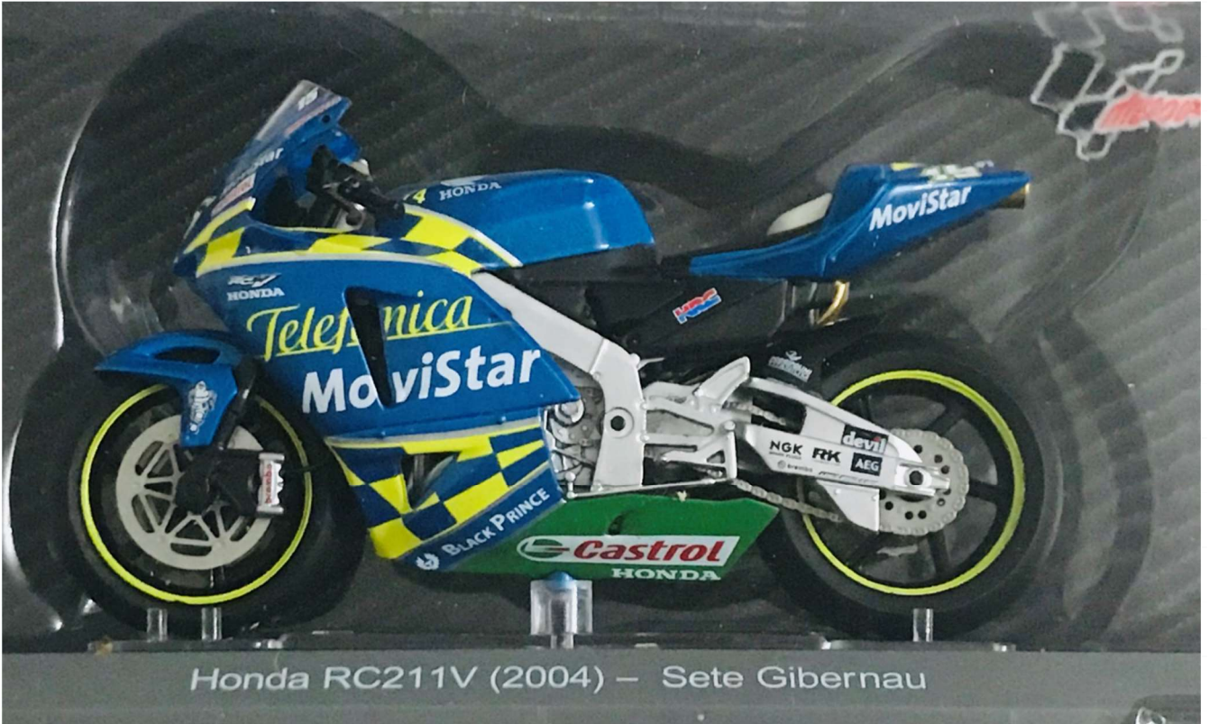
Honda RC211V (2004) – Sete Gibernau