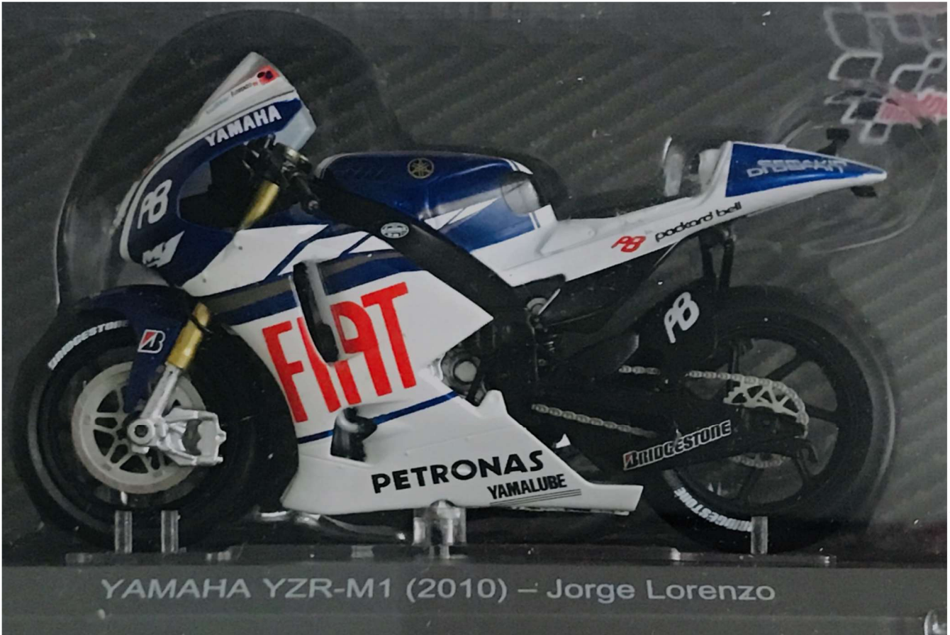
YAMAHA YZR-M1 (2010) – Jorge Lorenzo