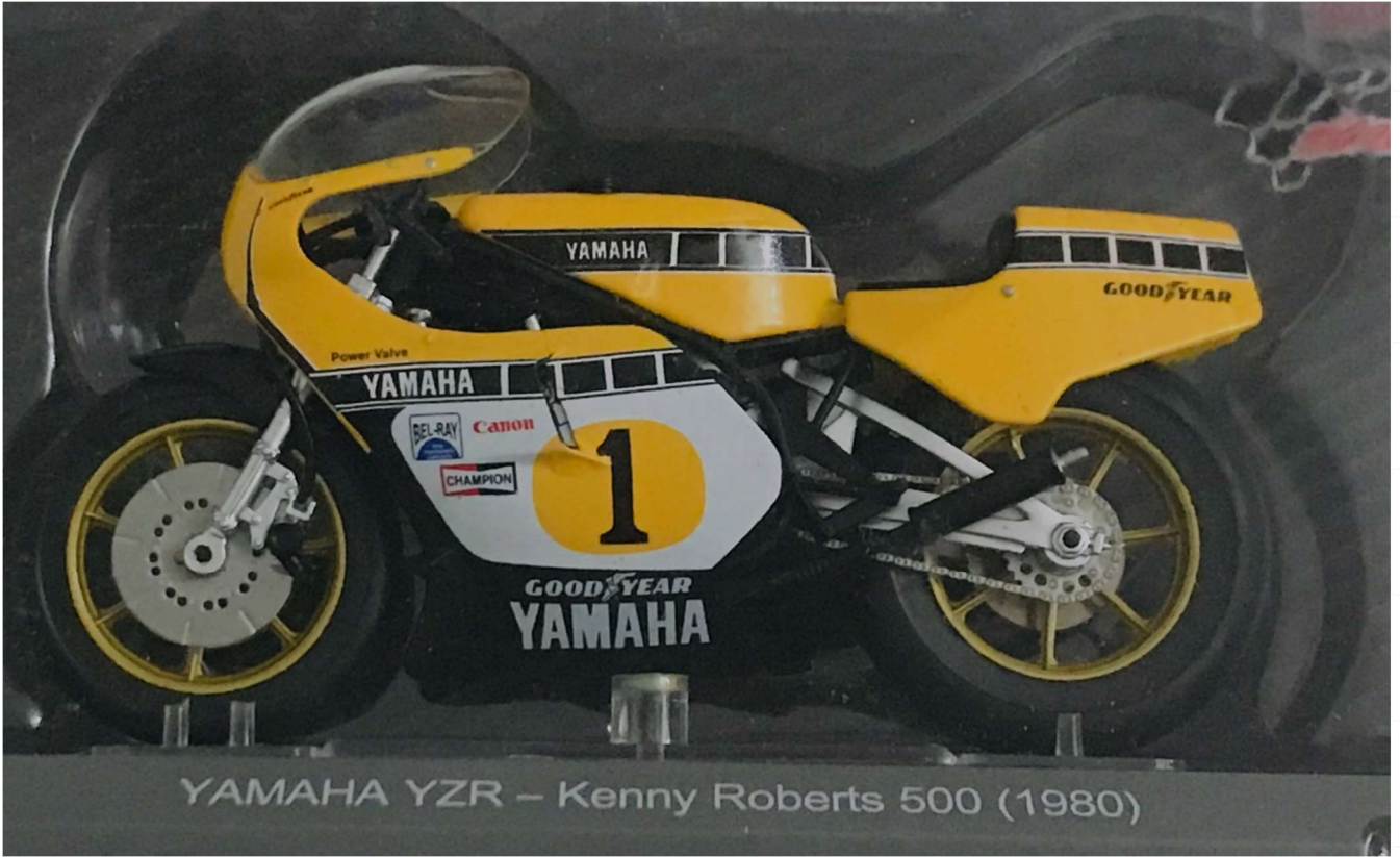
YAMAHA YZR – Kenny Roberts 500 (1980)