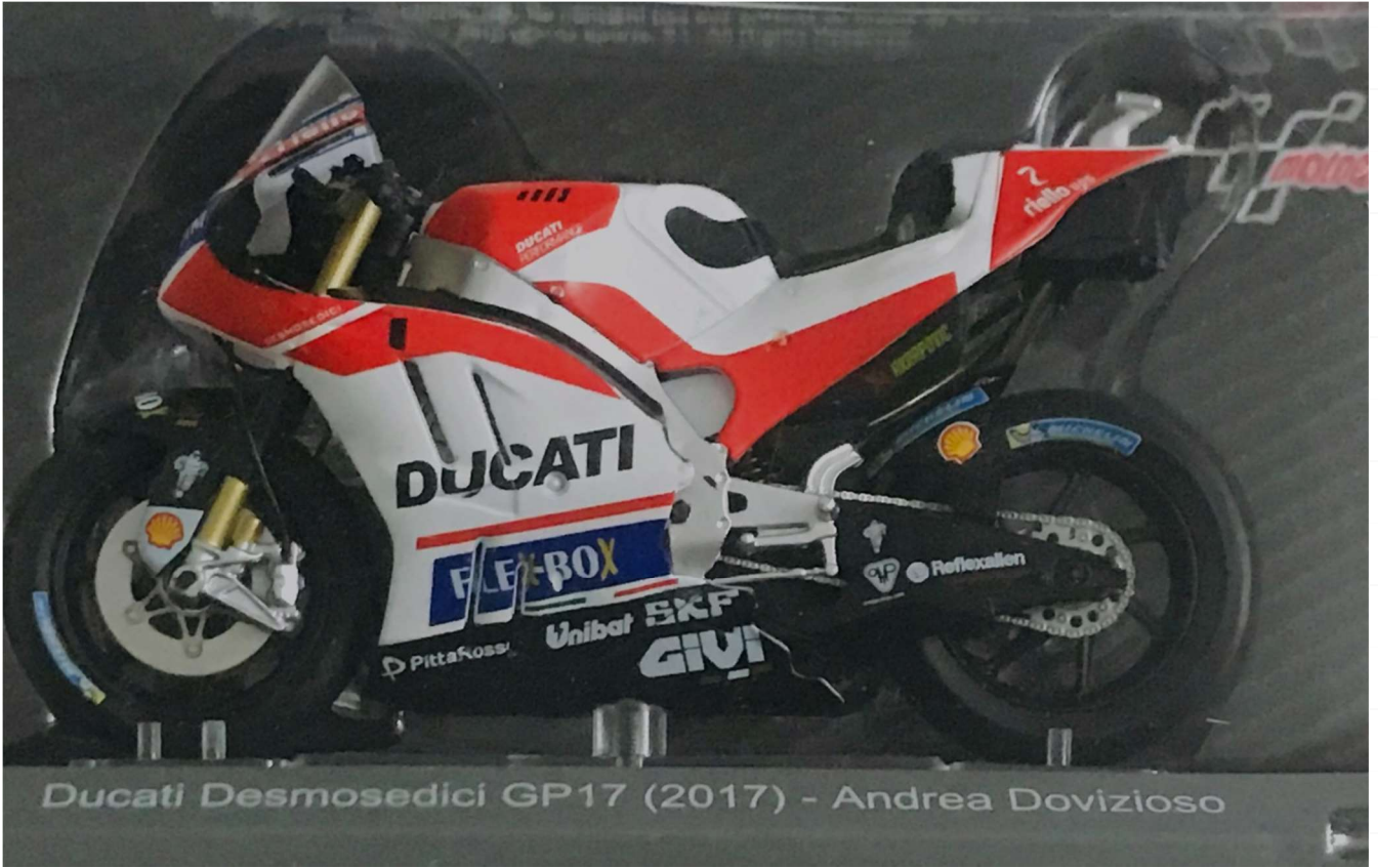
Ducati Desmosedici GP17 (2017) - Andrea Dovizioso