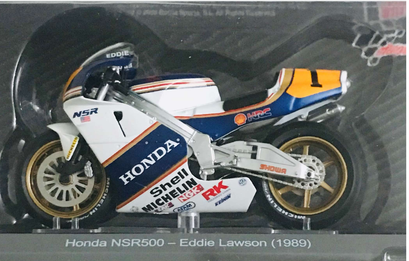
Honda NSR500 – Eddie Lawson (1989)