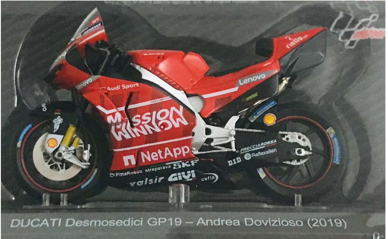
DUCATI Desmosedici GP19 – Andrea Dovizioso (2019)