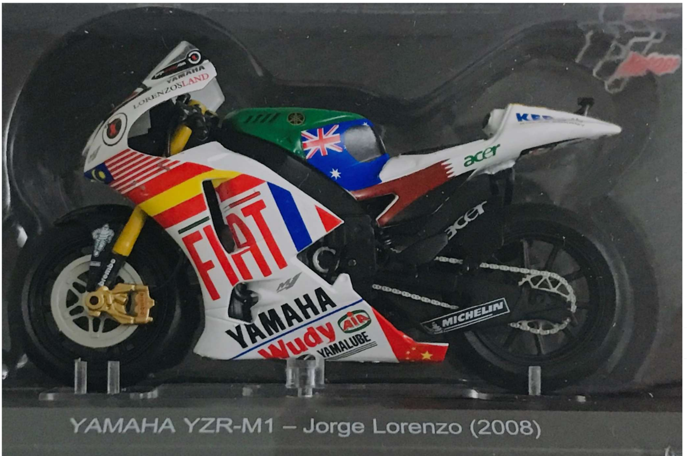
YAMAHA YZR-M1 – Jorge Lorenzo (2008)