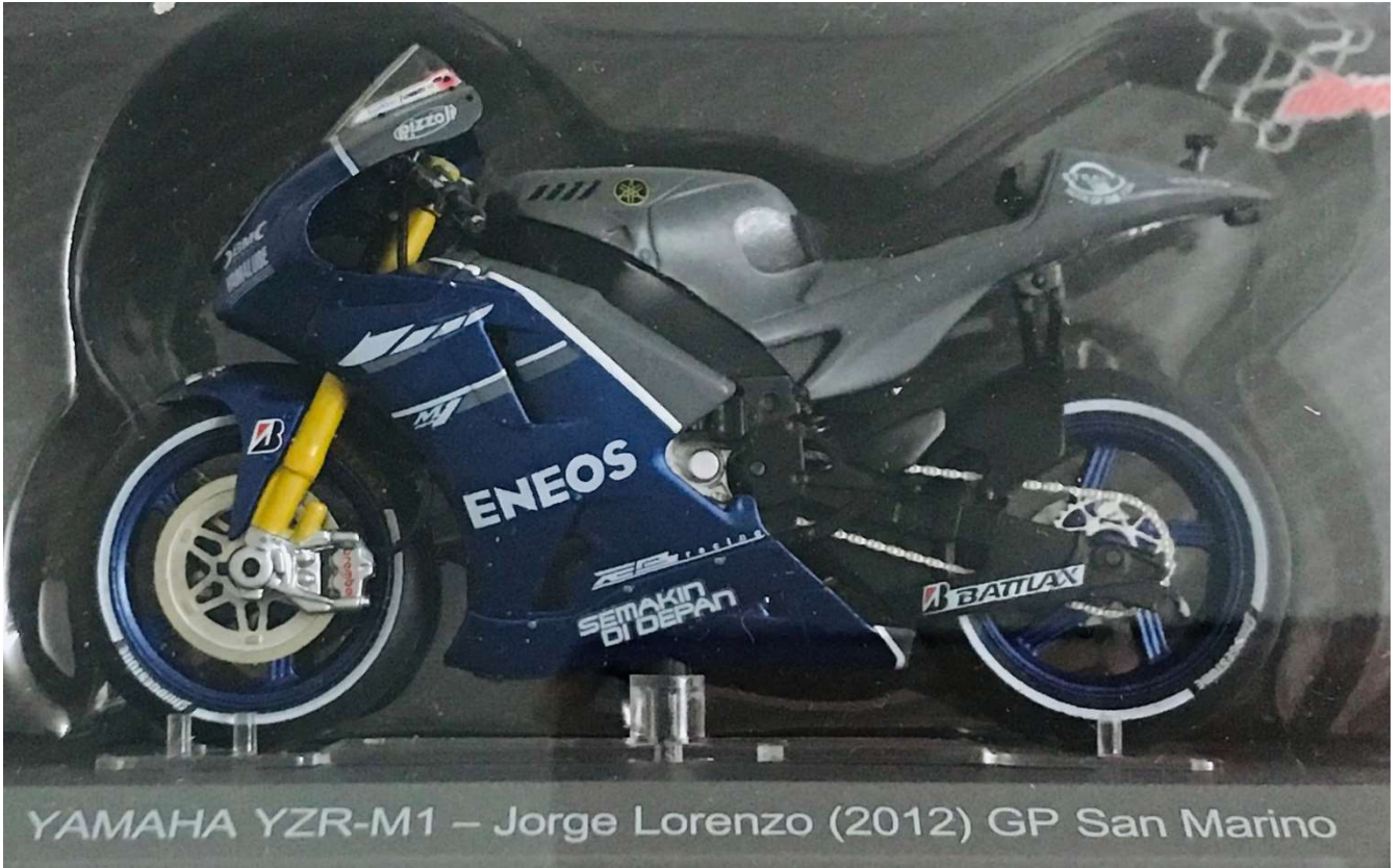
YAMAHA YZR-M1 – Jorge Lorenzo (2012) GP San Marino