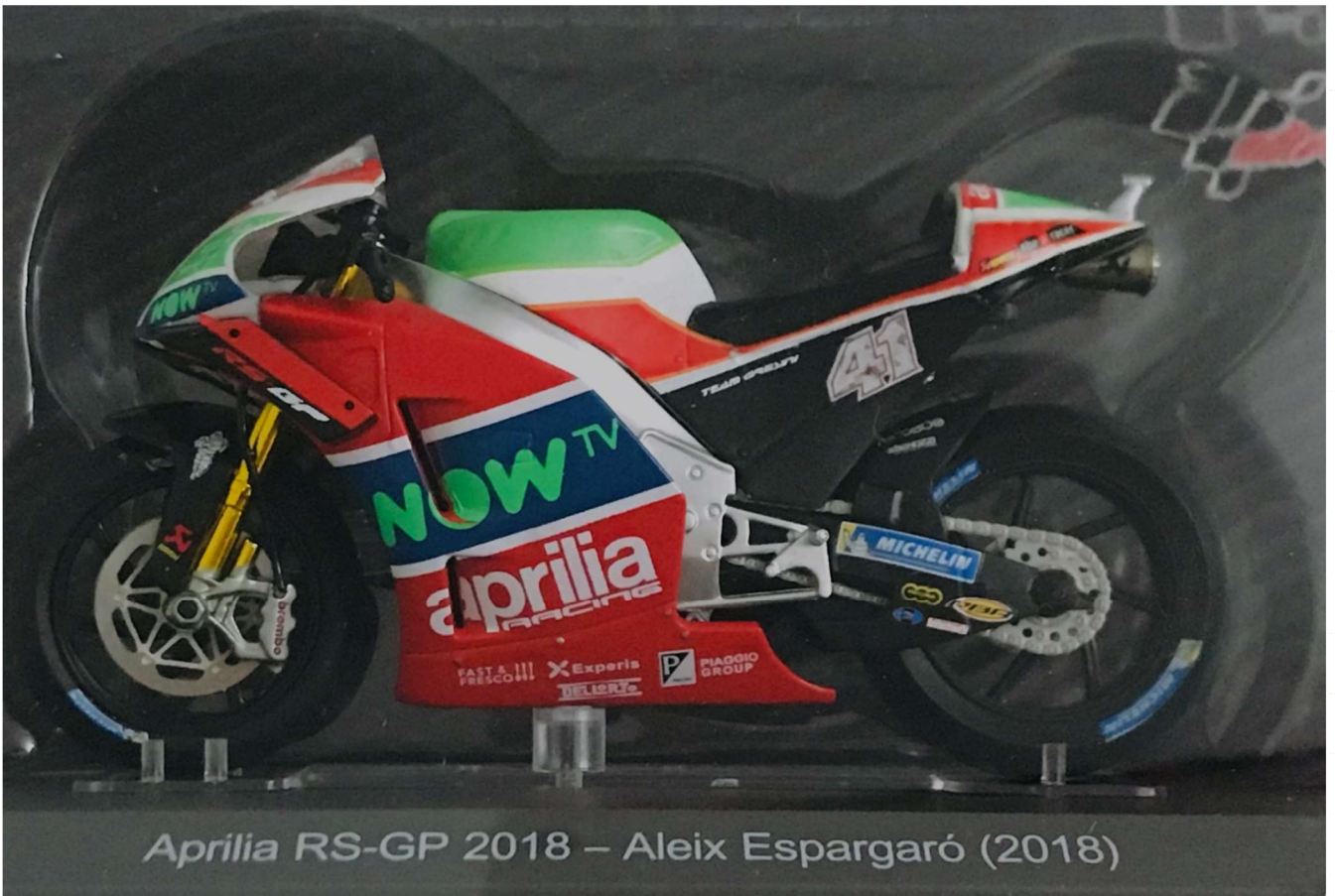
Aprilia RS-GP 2018 – Aleix Espargaró (2018)