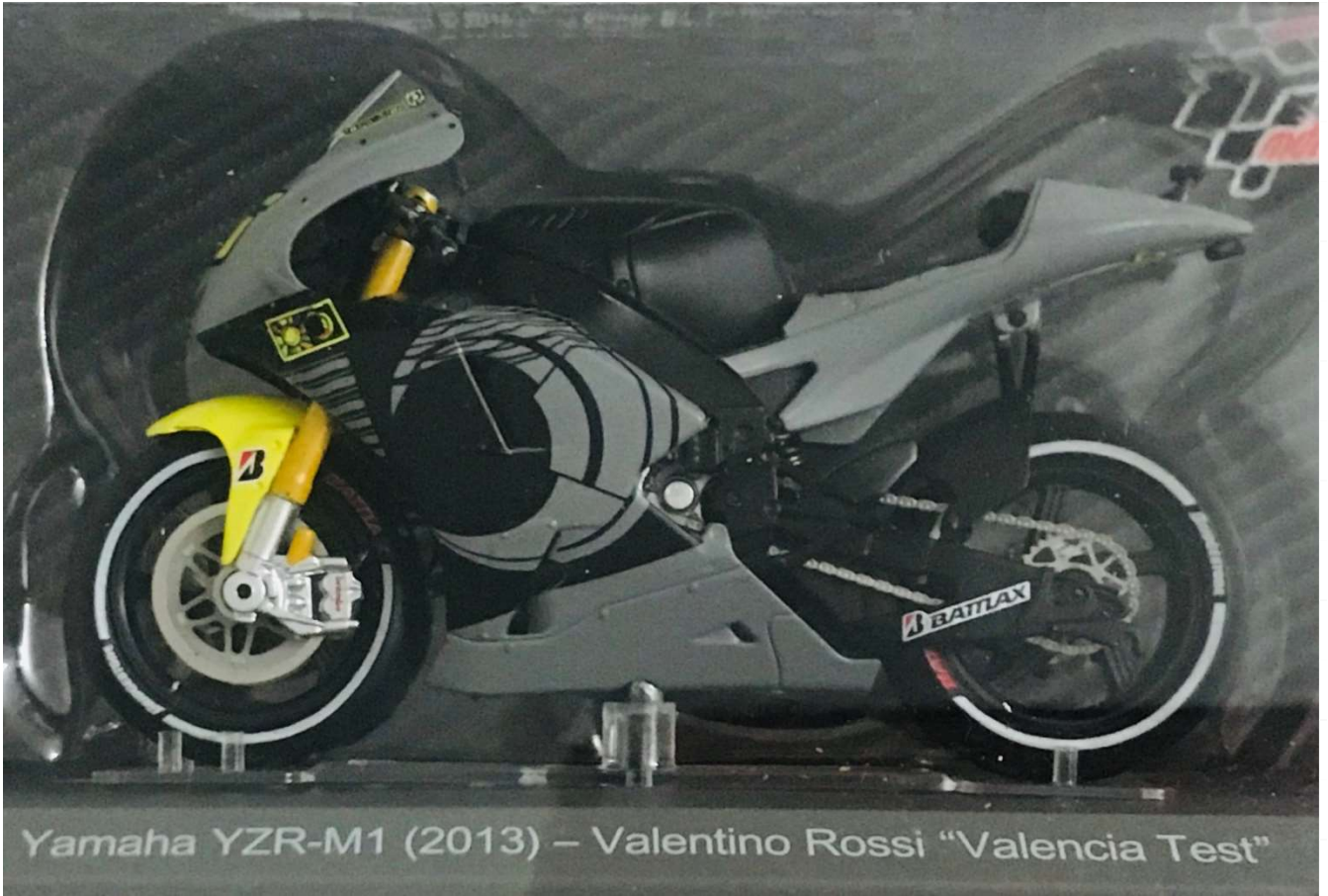
Yamaha YZR-M1 (2013) – Valentino Rossi "Valencia Test"