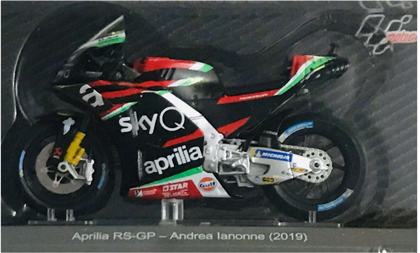
Aprilia RS-GP – Andrea Iannone (2019)