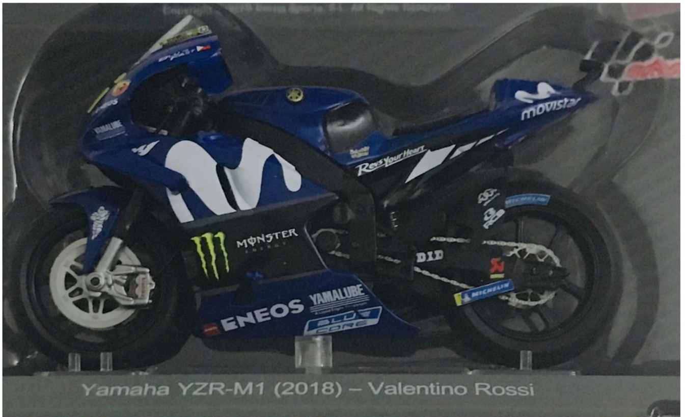
Yamaha YZR-M1 (2018) – Valentino Rossi