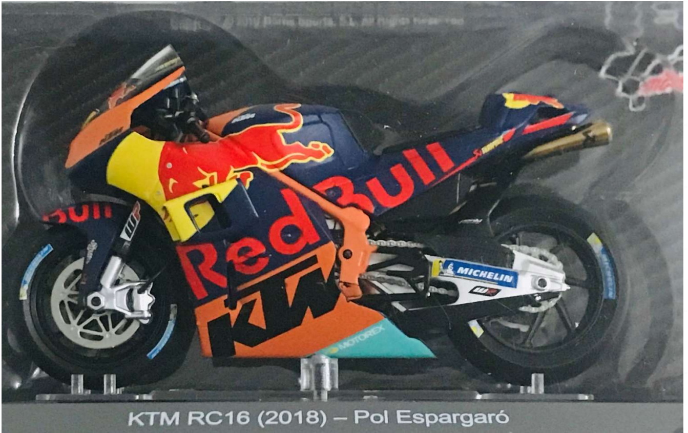
KTM RC16 (2018) – Pol Espargaró