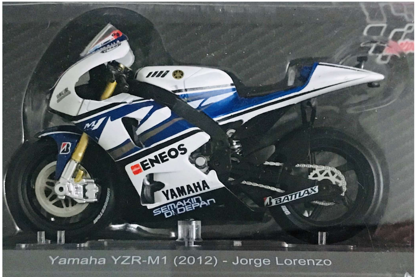
Yamaha YZR-M1 (2012) - Jorge Lorenzo