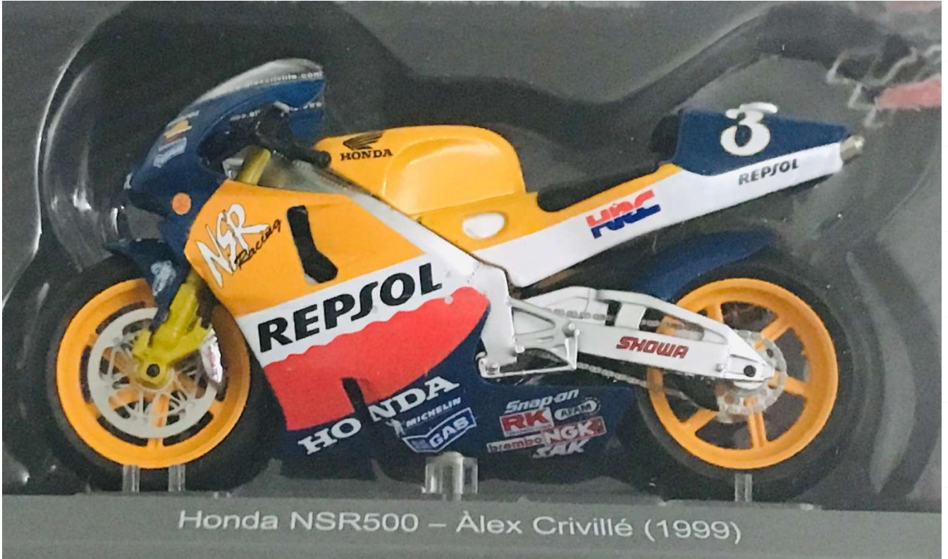
Honda NSR500 – Alex Crivillé (1999)