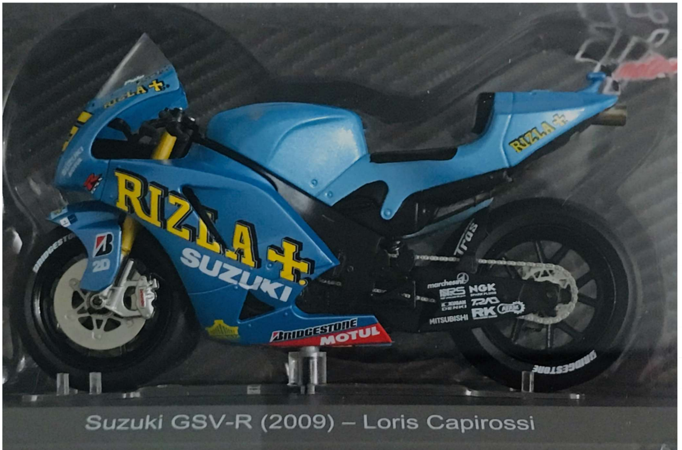
Suzuki GSV-R (2009) – Loris Capirossi