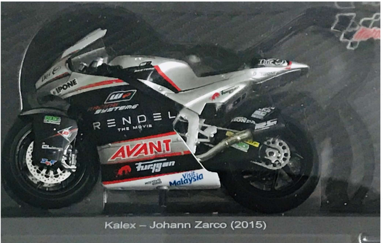
Kalex – Johann Zarco (2015)