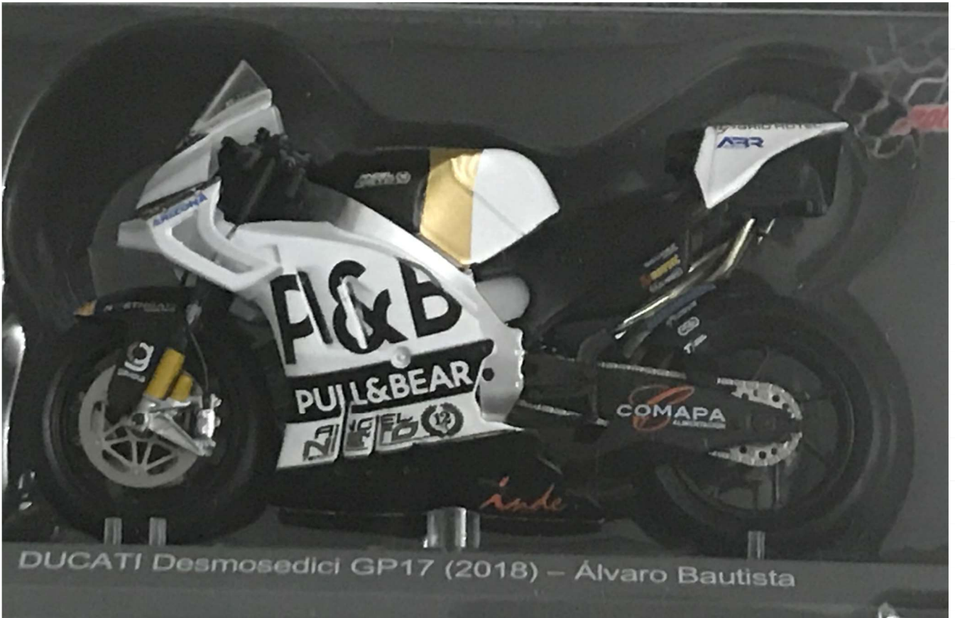
DUCATI Desmosedici GP17 (2018) – Álvaro Bautista