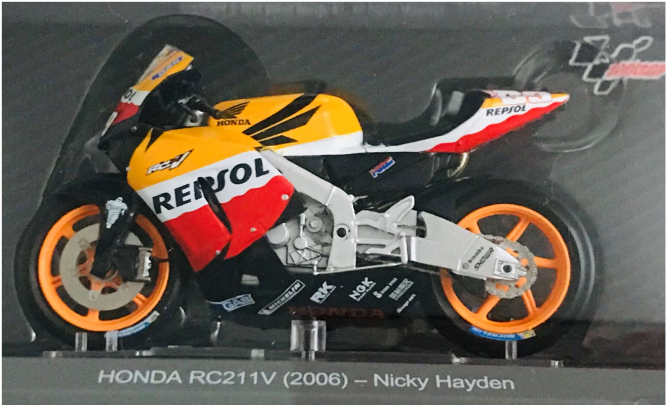
HONDA RC211V (2006) – Nicky Hayden