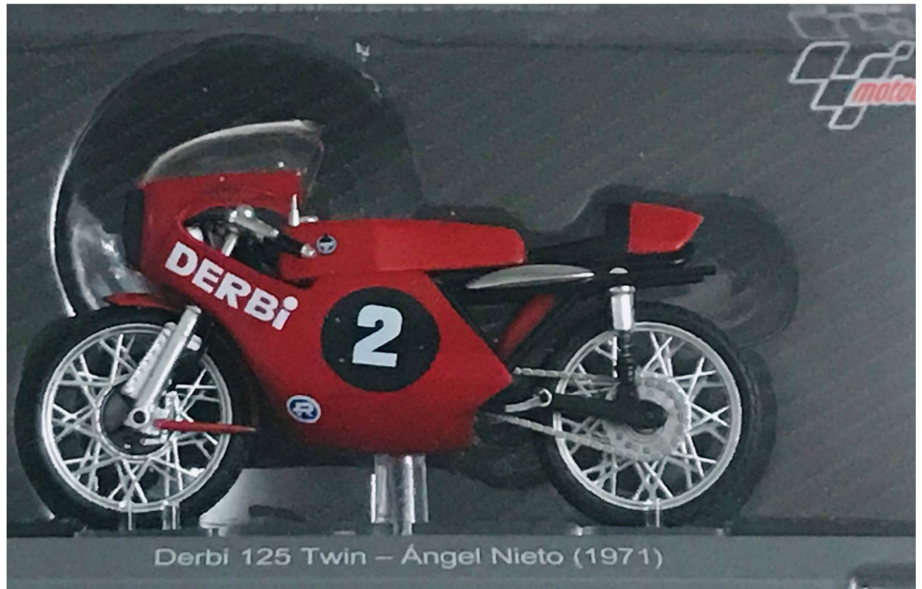
Derbi 125 Twin – Ángel Nieto (1971)