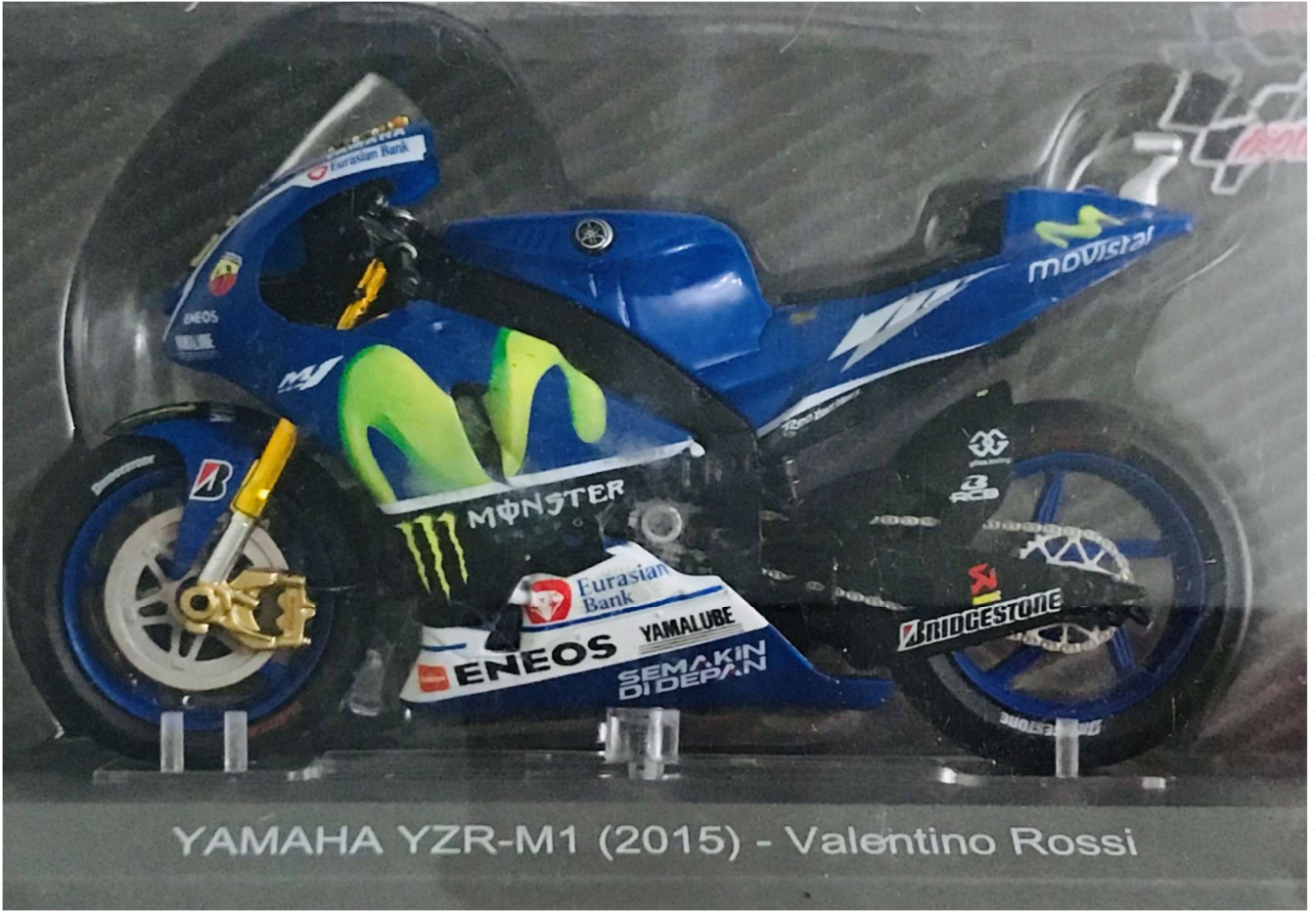
YAMAHA YZR-M1 (2015) - Valentino Rossi