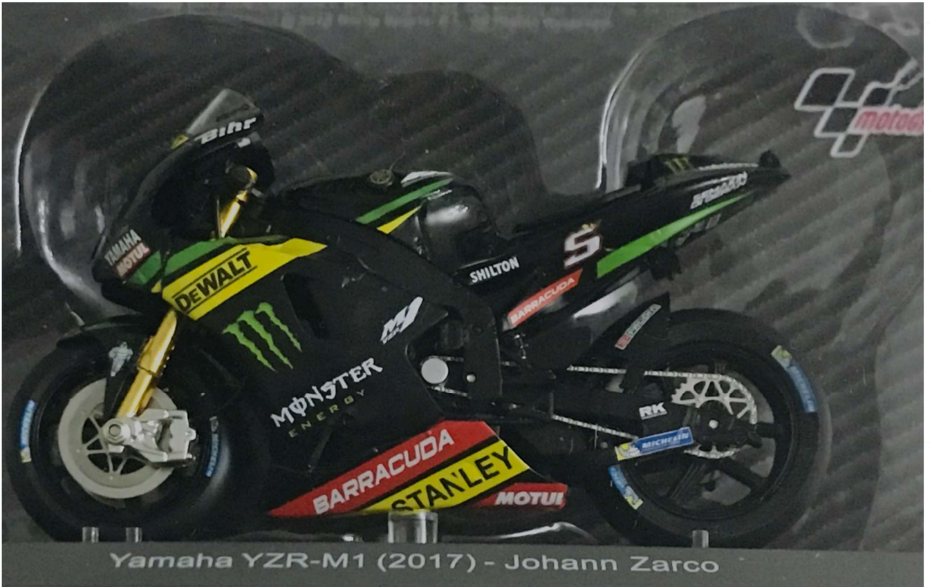
Yamaha YZR-M1 (2017) - Johann Zarco