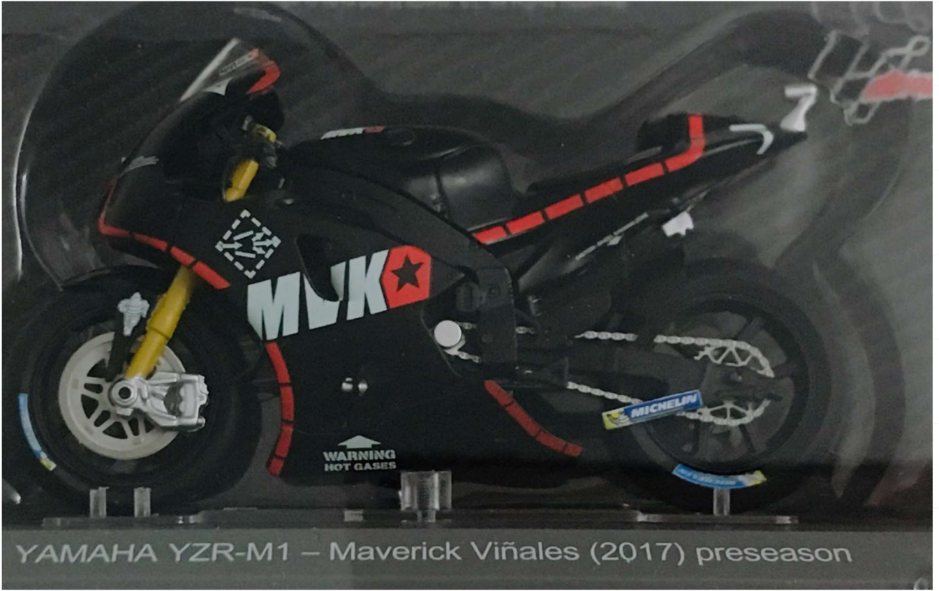
YAMAHA YZR-M1 – Maverick Viñales (2017) preseason