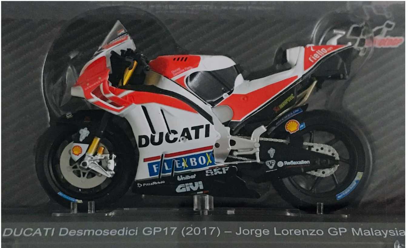
DUCATI Desmosedici GP17 (2017) – Jorge Lorenzo GP Malaysia