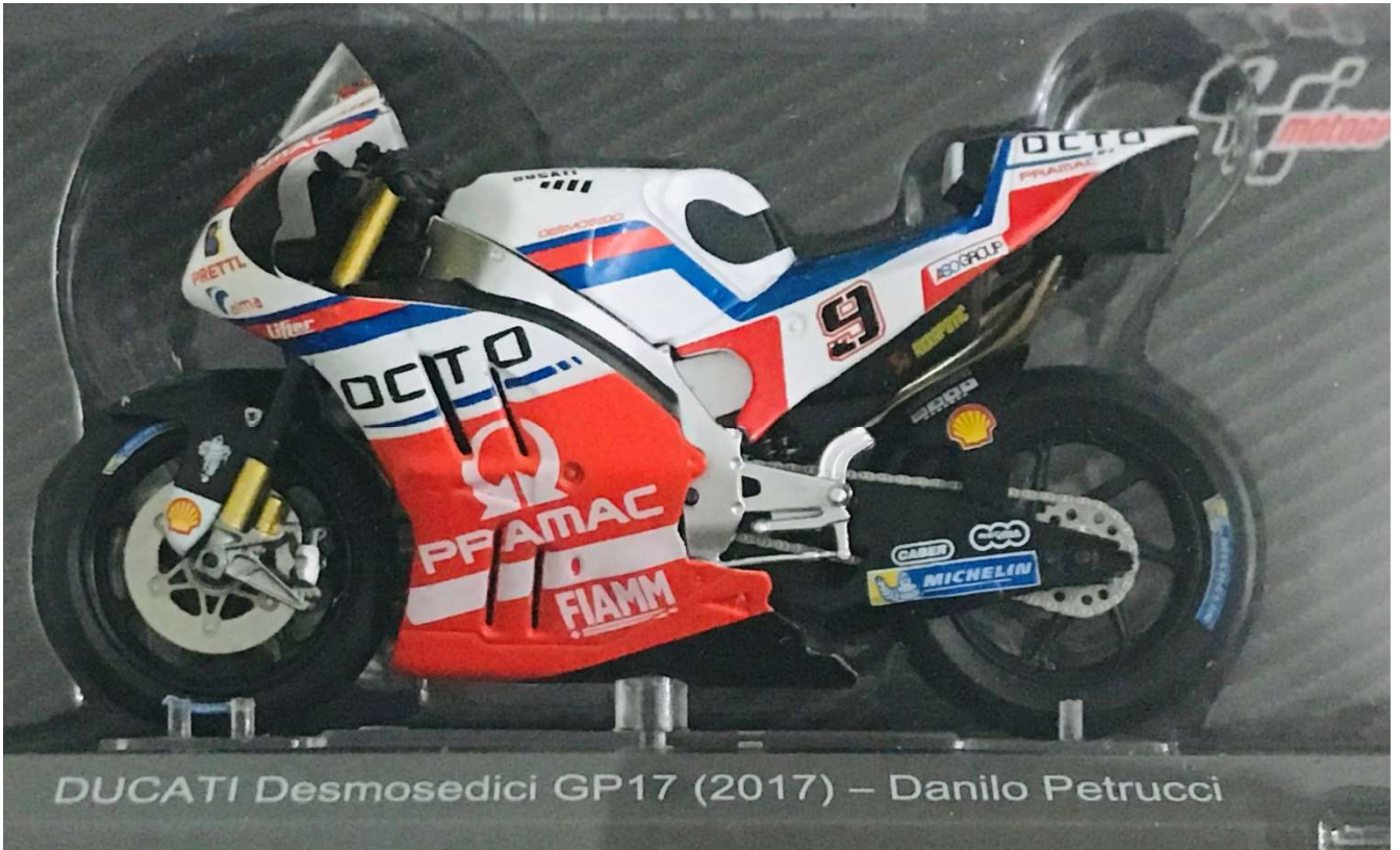
DUCATI Desmosedici GP17 (2017) - Danilo Petrucci