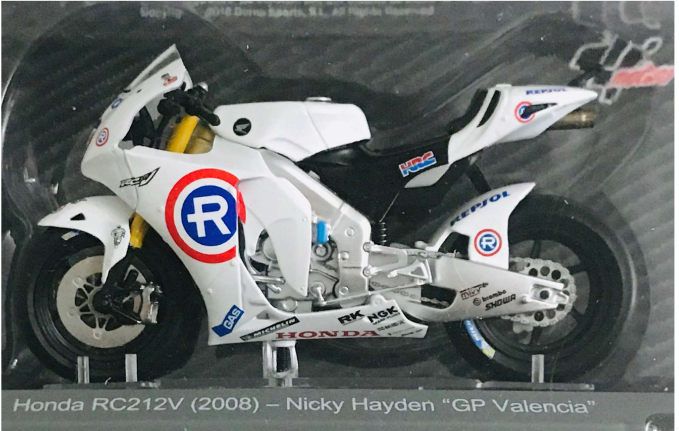
Honda RC212V (2008) – Nicky Hayden "GP Valencia"