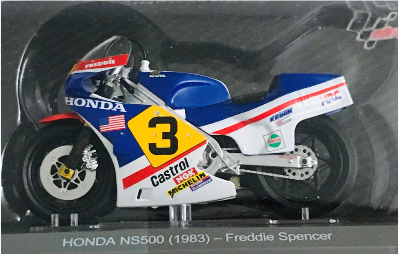
HONDA NS500 (1983) – Freddie Spencer