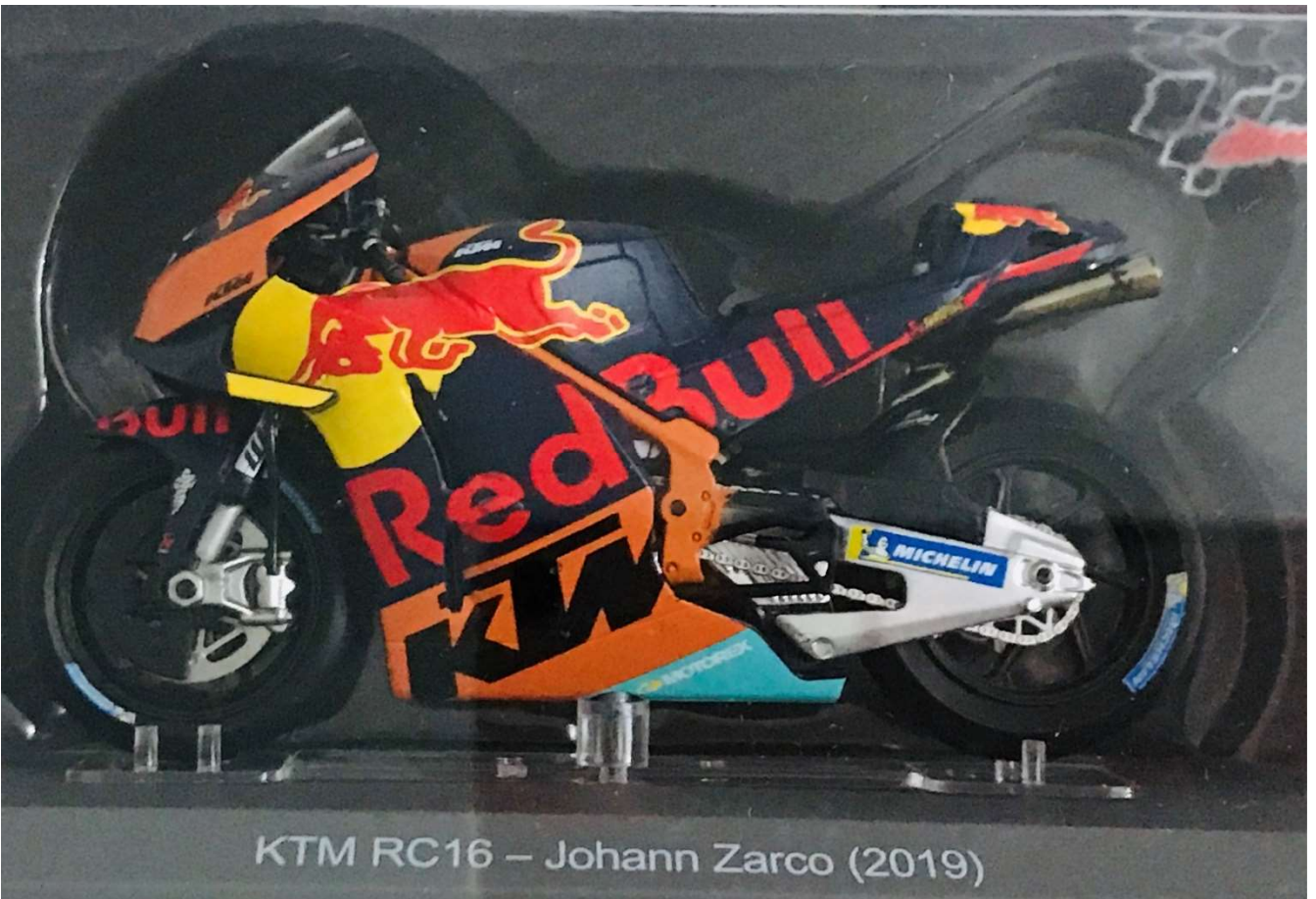
KTM RC16 - Johann Zarco (2019)