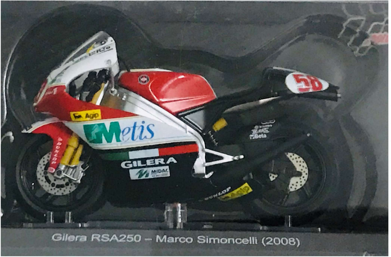
Gilera RSA250 – Marco Simoncelli (2008)