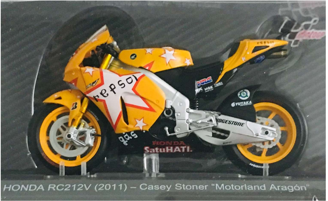
HONDA RC212V (2011) – Casey Stoner "Motorland Aragón"