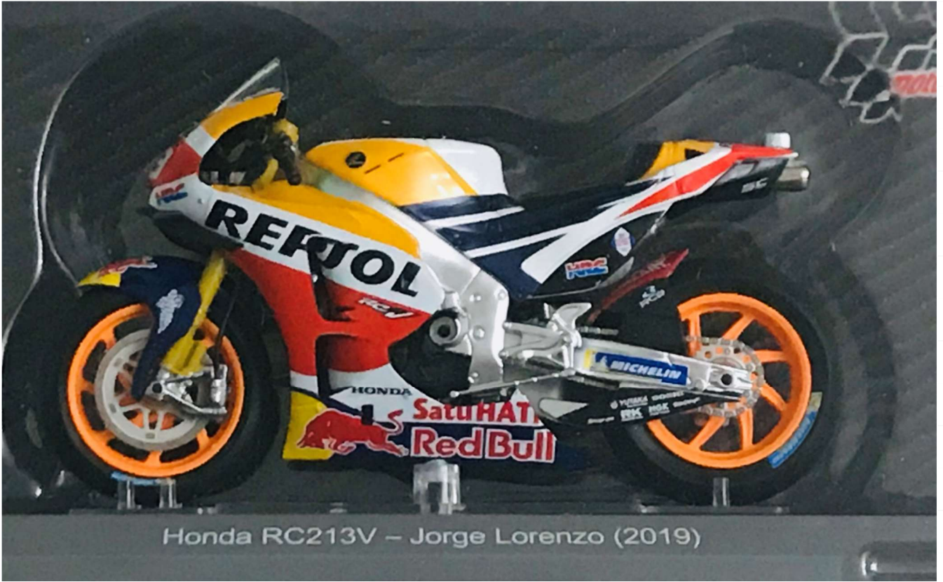
Honda RC213V – Jorge Lorenzo (2019)