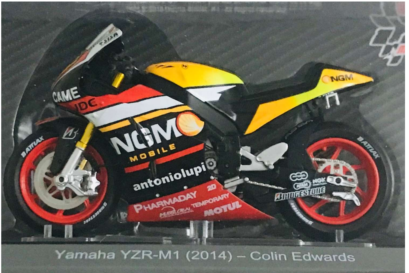
Yamaha YZR-M1 (2014) - Colin Edwards