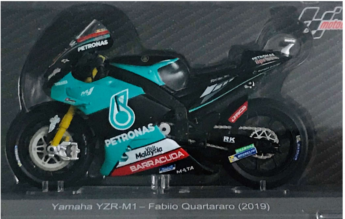
Yamaha YZR-M1 – Fabio Quartararo (2019)