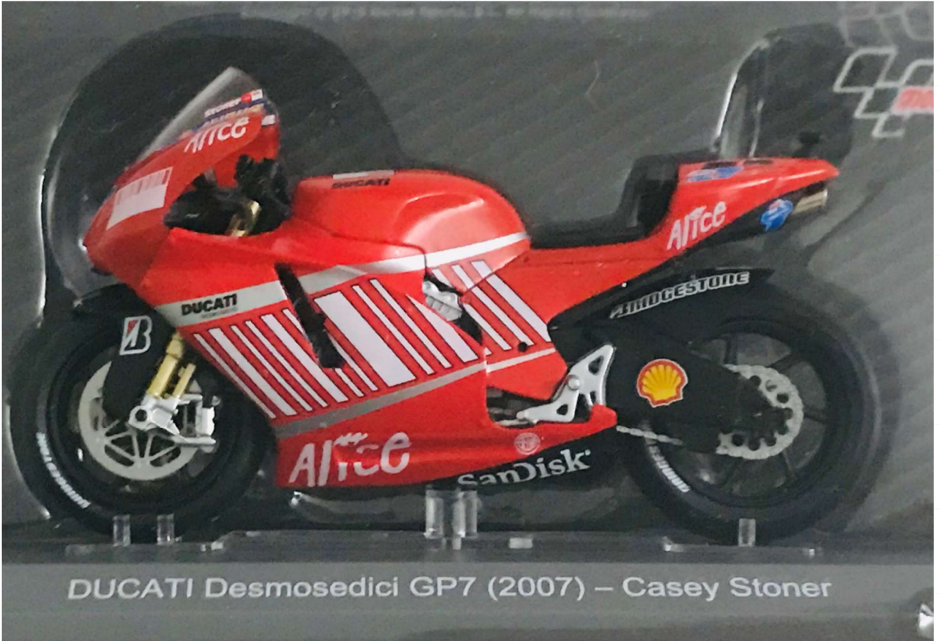
DUCATI Desmosedici GP7 (2007) – Casey Stoner