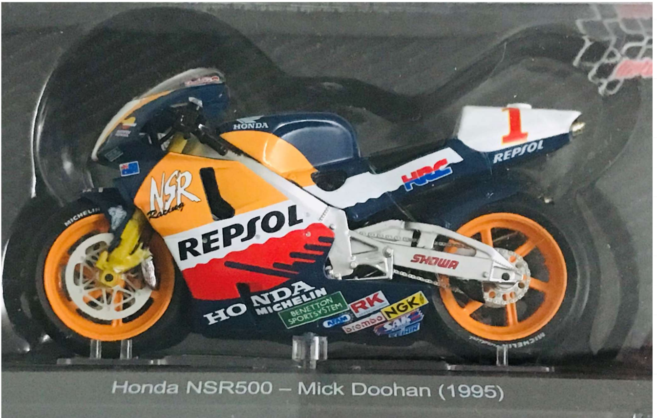
Honda NSR500 – Mick Doohan (1995)