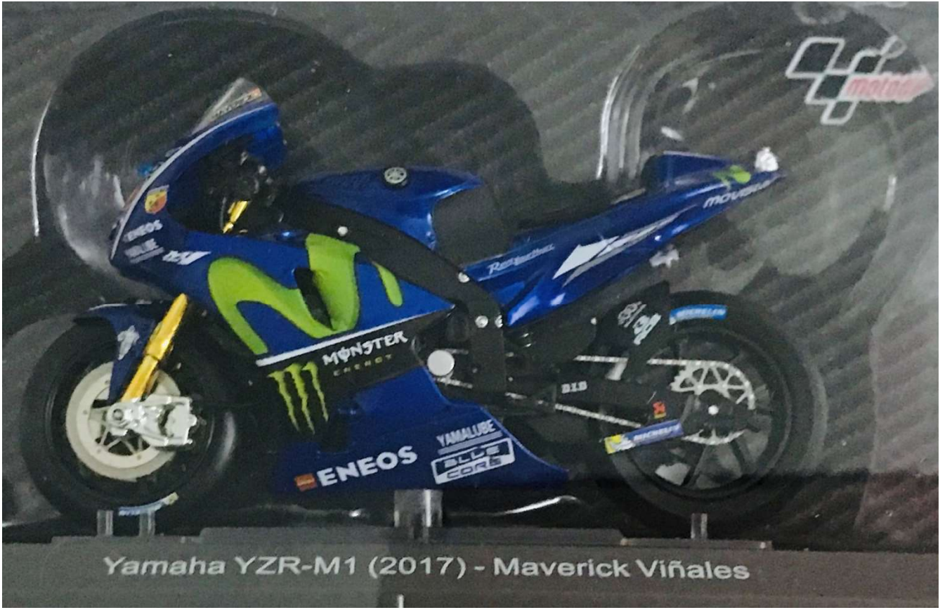
Yamaha YZR-M1 (2017) - Maverick Viñales