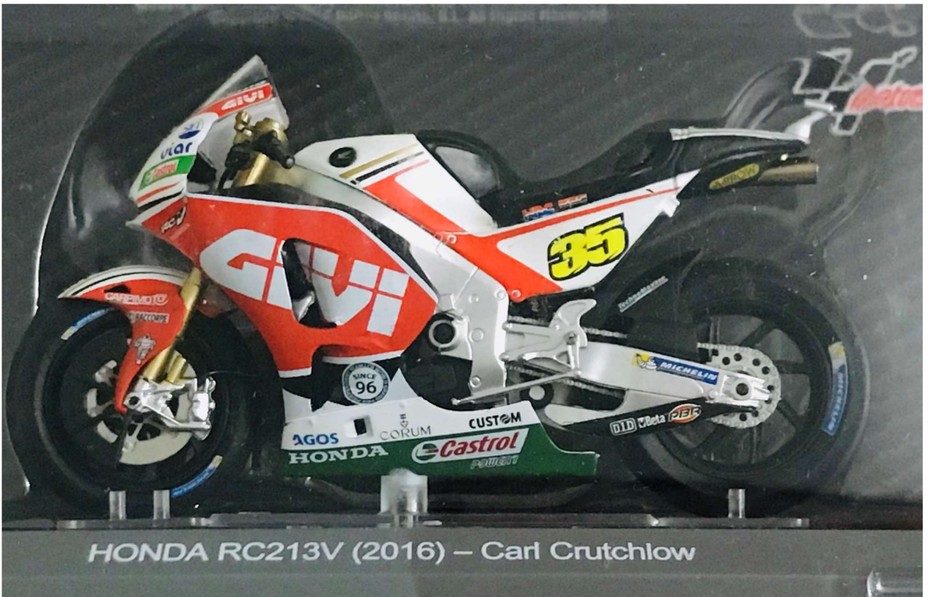
HONDA RC213V (2016) – Carl Crutchlow