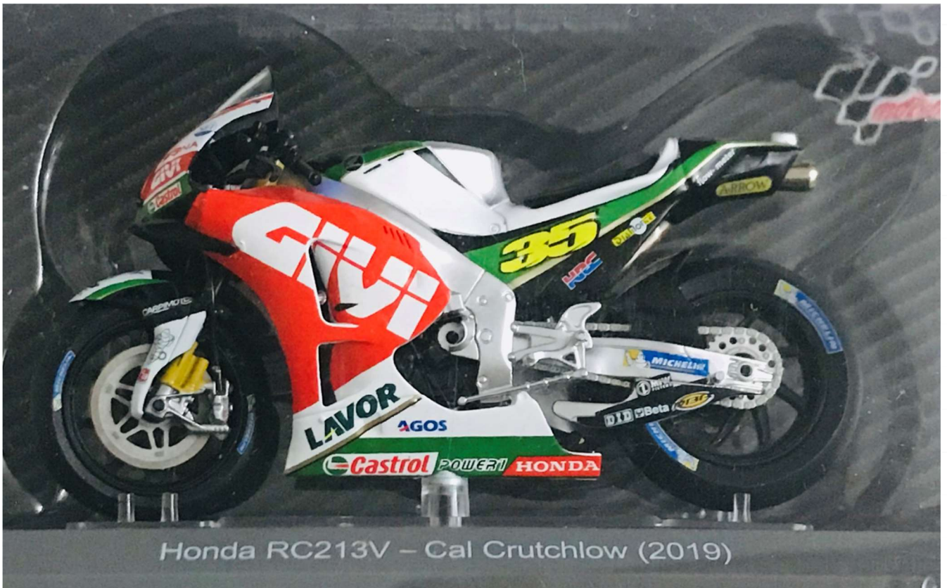
Honda RC213V – Cal Crutchlow (2019)