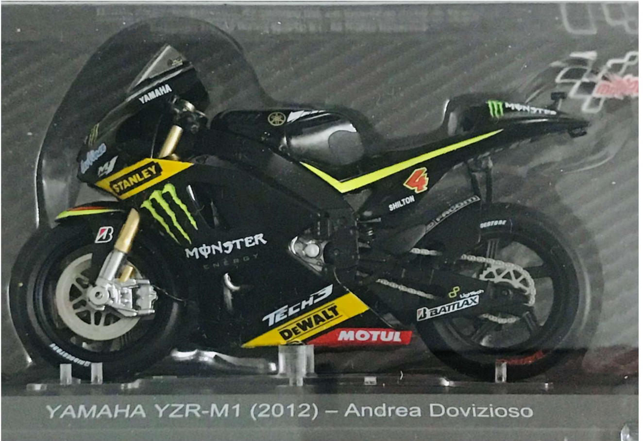
YAMAHA YZR-M1 (2012) – Andrea Dovizioso