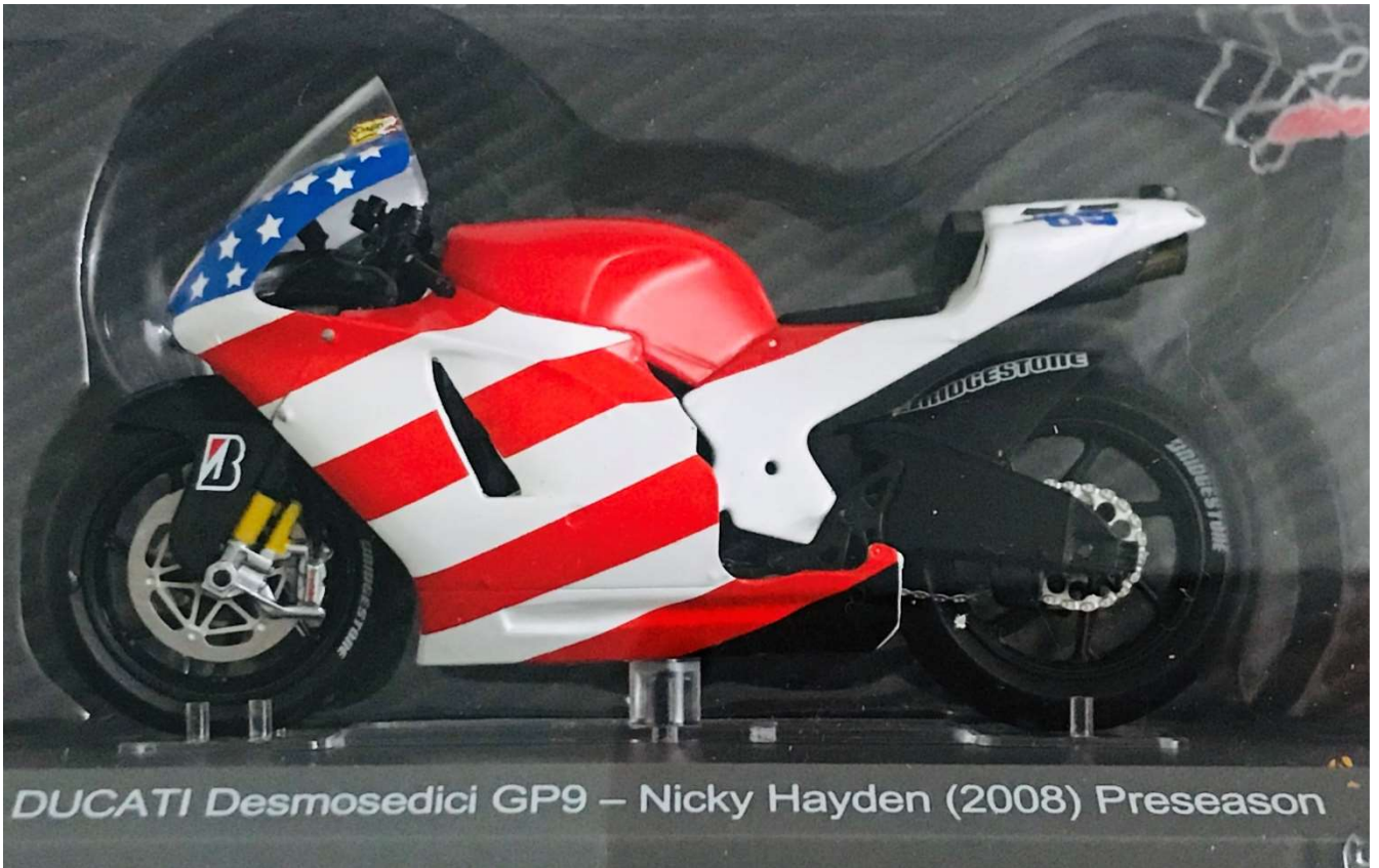
DUCATI Desmosedici GP9 – Nicky Hayden (2008) Preseason