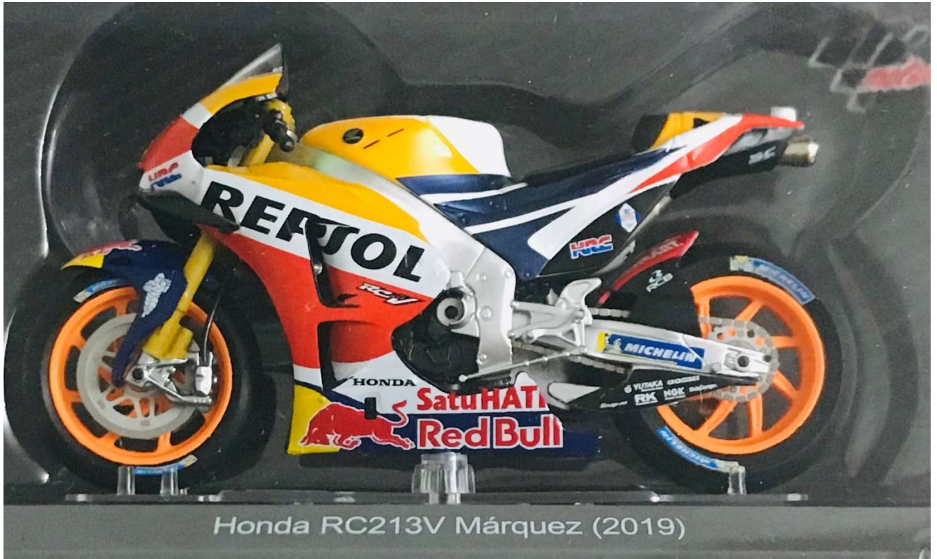
Honda RC213V Márquez (2019)