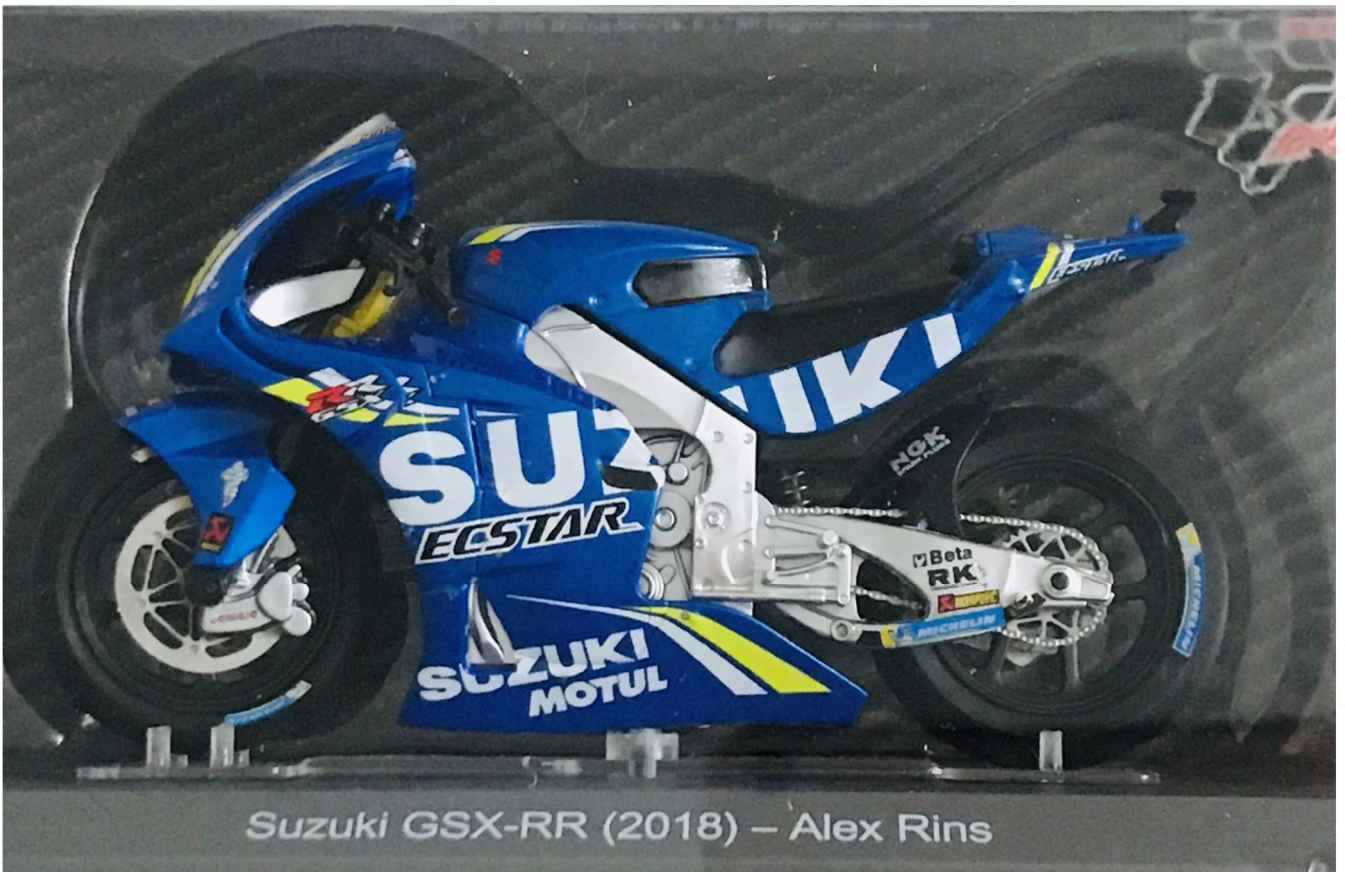
Suzuki GSX-RR (2018) – Alex Rins