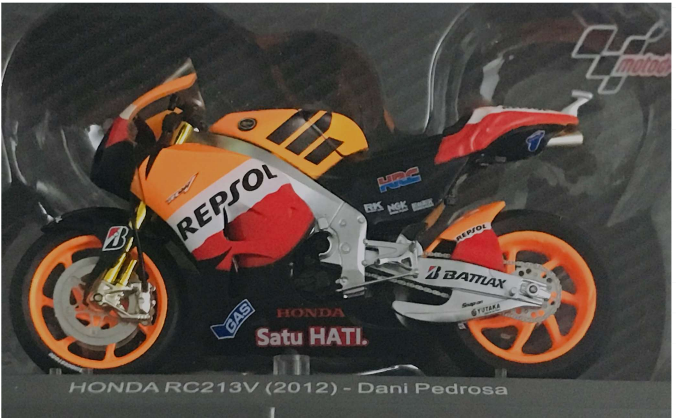
HONDA RC213V (2012) - Dani Pedrosa