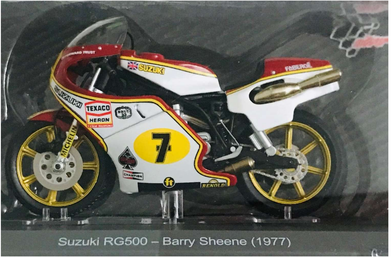
Suzuki RG500 – Barry Sheene (1977)