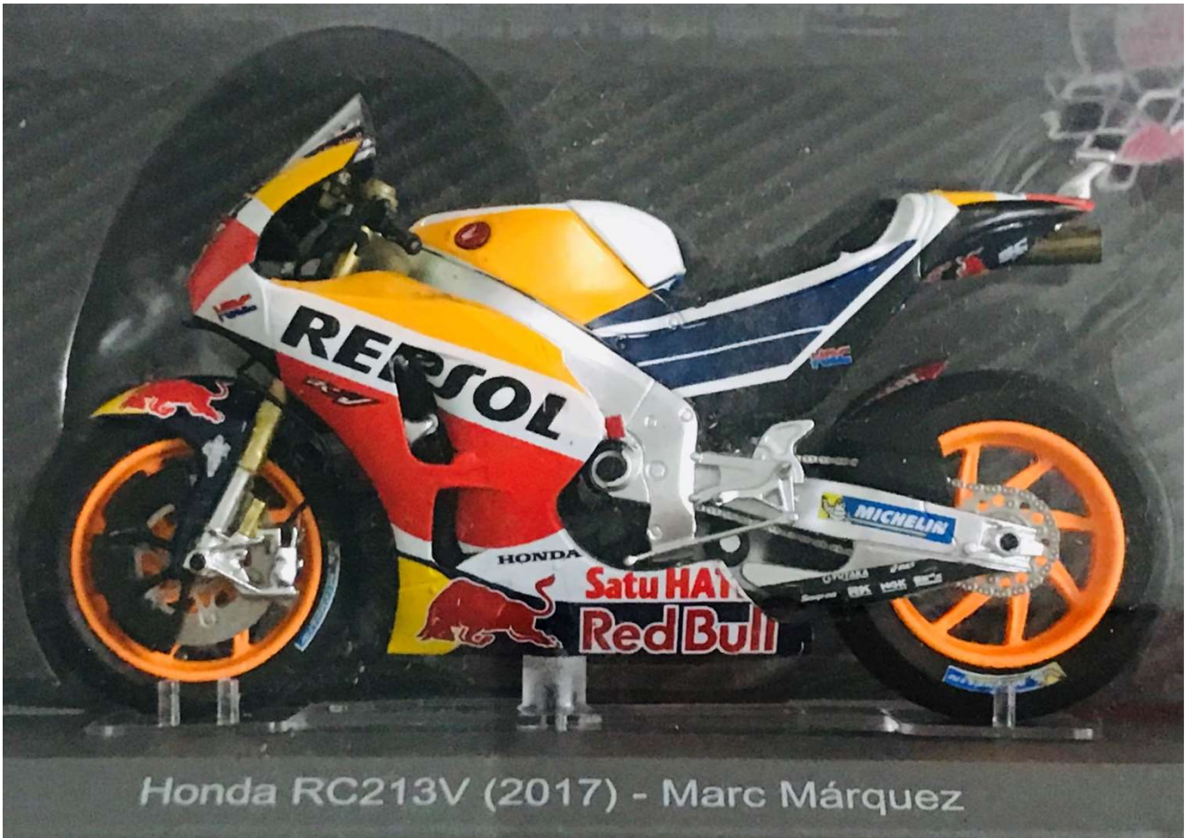
Honda RC213V (2017) - Marc Márquez