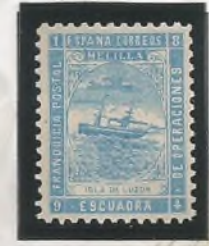
Cru. Isla de Luzón