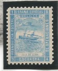
Cru. Isla de Cuba