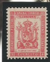
Santiago, de Caballería

Serie dedicada a diversos Regimientos de Infantería (Santiago, Granada, Pavía, Saboya, San Fernando, San Quintín y Toledo), con el añadido de Cazadores de Santiago, de Caballería, Se encuentran ejemplares en colores rosa carmín, carmín o carmín rojo.