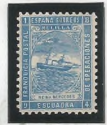
Cru. R. Mercedes