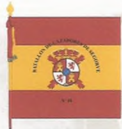
Batallón de Cazadores Segorbe