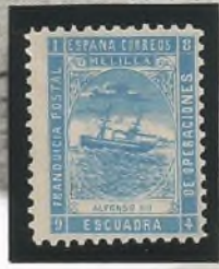
Cru. Alfonso XII