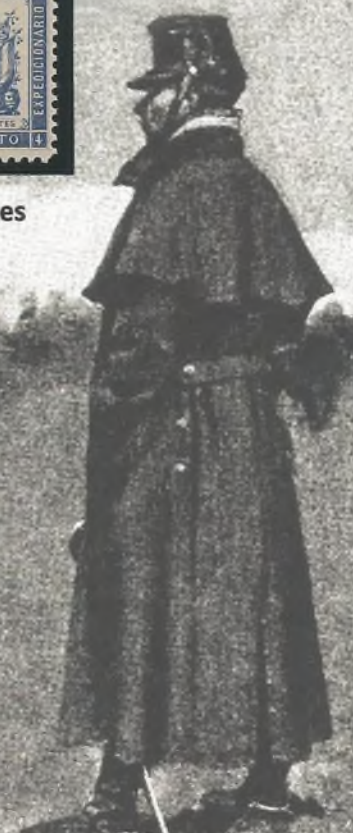
Cazador de Melilla

Serie dedicada a diversos Regimientos de Infantería (África, Soria, Extremadura, Guipúzcoa, Infantes, Luchana y Mallorca) y a la sección Máuser. Se encuentran ejemplares en azul o azul oscuro.